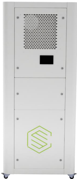
air cube 450